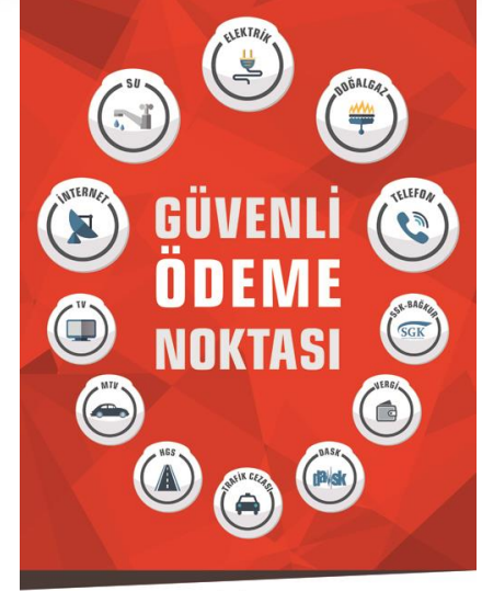
50 X 70 Pano