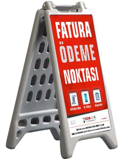
74 X 100 Çift Yönlü Duba (Opsiyonel)