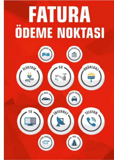
50 x 150 Kırlangıç Bayrak